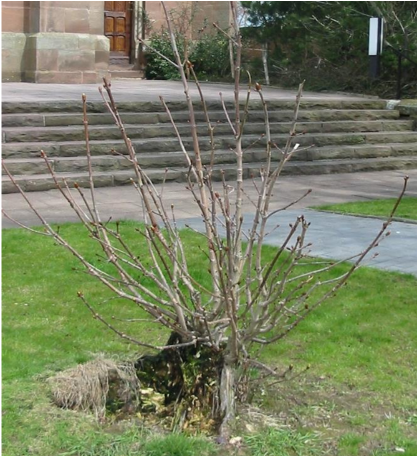
Vor der Kirche in Bernshausen/Eichsfeld - Foto: P. Rudolf Götz

St. Michael, Burghausen Foto: P. Rudolf Götz