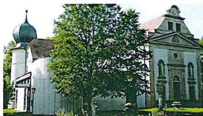
St. Laurentius, Thundorf